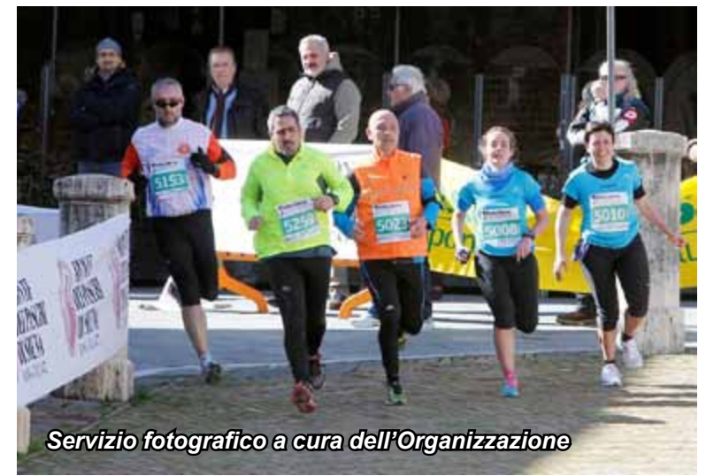
Servizio fotografico a cura dell'Organizzazione