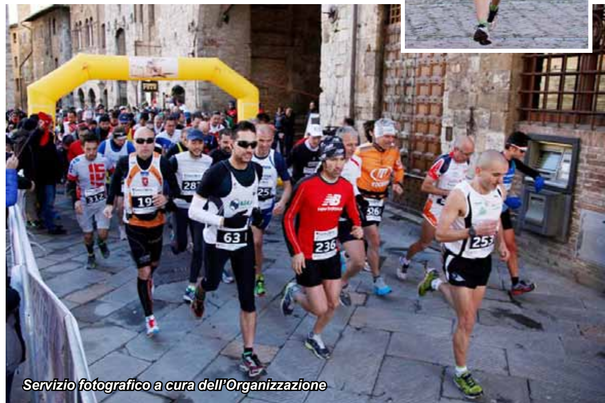
Servizio fotografico a cura dell'Organizzazione

Dalle Pagine Facebook di Runners e Benessere e Terre di Siena Ultra Marathon.